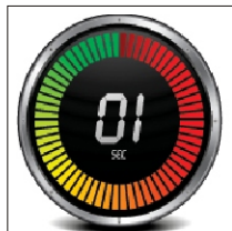
间隙式及接触式焊接之间的快速转换