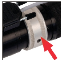
Instant switching between gap and contact welding.