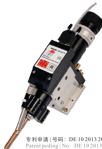
专利申请 | 号码: DE 10 2013 201 464 A1 Patent pending | No. :DE 10 2013 201 464 A1